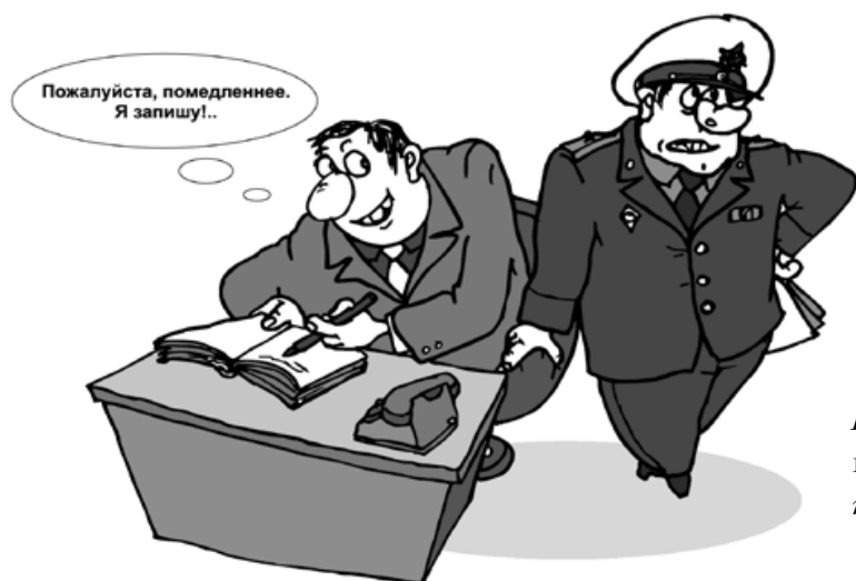
Иллюстрация из руководства «К Вам пришла проверка», изданного Новороссийской торгово-промышленной палатой при поддержке СИРЕ.

СИРЕ включают: комиксы и карикатуры, хорошо запоминающиеся лозунги, а также буклеты, написанные ясным и простым языком, а не тяжелыми юридическими терминами. Кроме того, в выявлении коррупционных практик и привлечении внимания широкой общественности могут помочь местные СМИ.